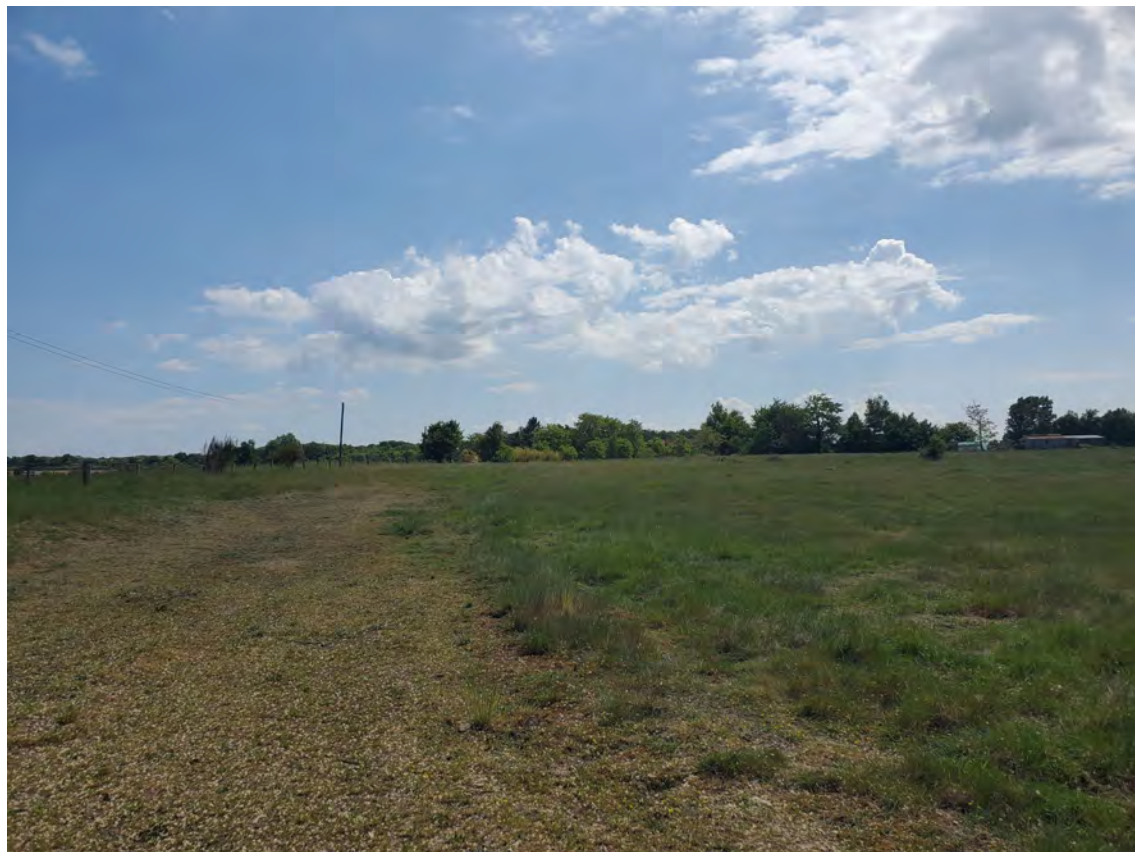
PDV 1a - Localisation du projet dans son environnement proche