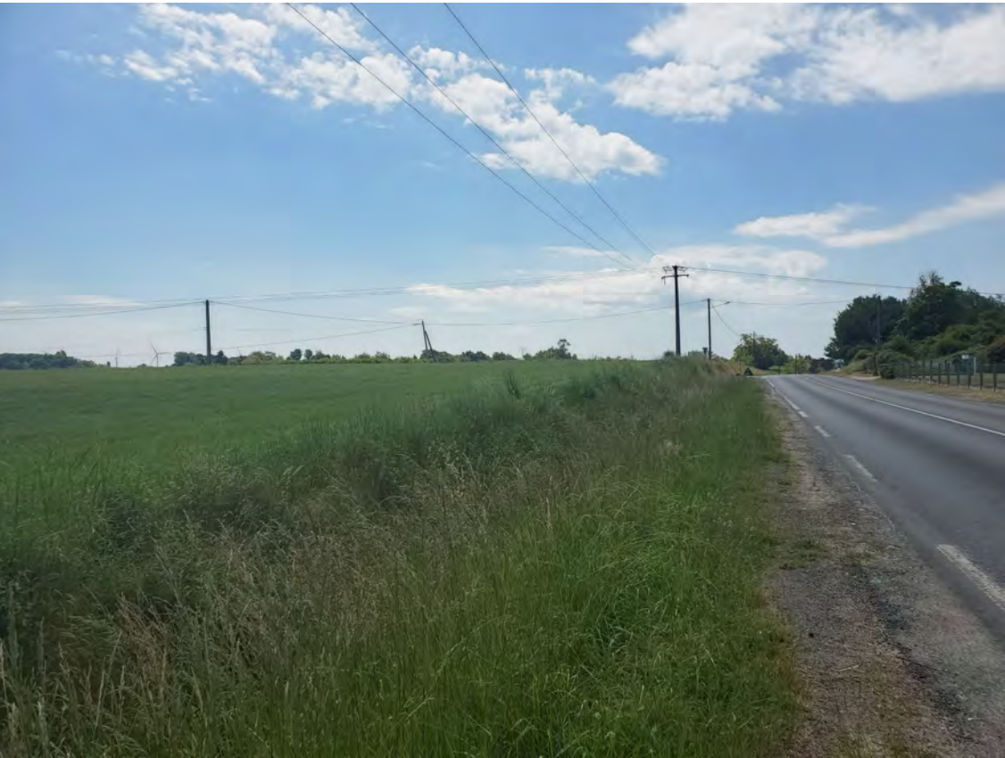
PDV 2 - Localisation du projet dans son environnement lointain