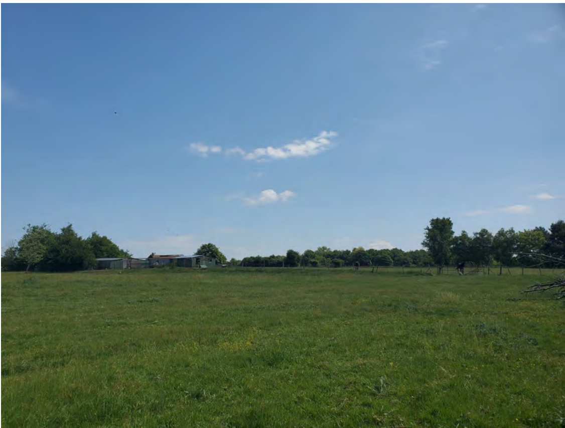
PDV 1b - Localisation du projet dans son environnement proche