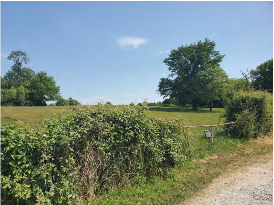
PDV 1c - Localisation du projet dans son environnement proche